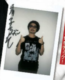
怒髪天のメンバー写真